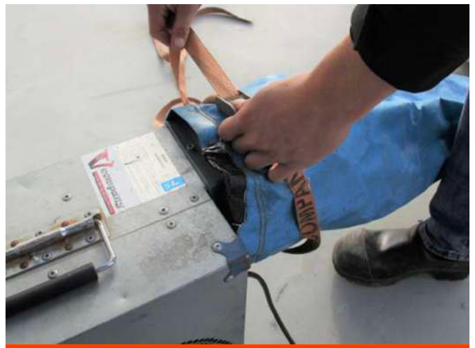
8. Sluit het kussen aan op de blower en bevestig deze met de spanband;