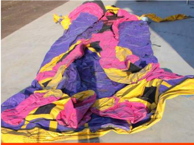
5. Vouw de andere kant van het kussen uit;