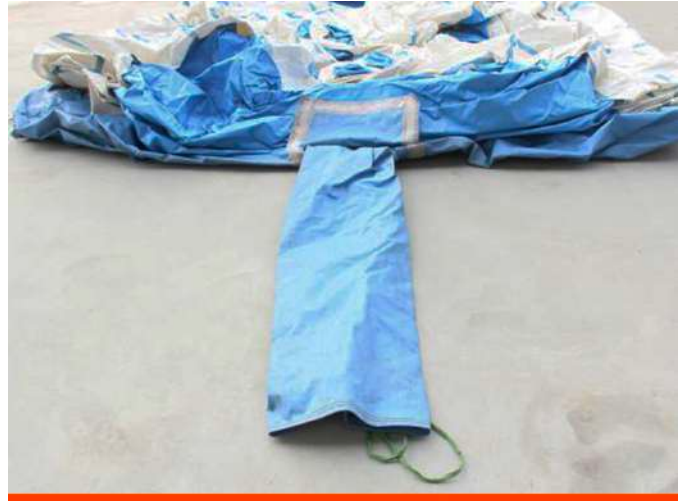
6. Zorg dat de slurf niet is gedraaid;