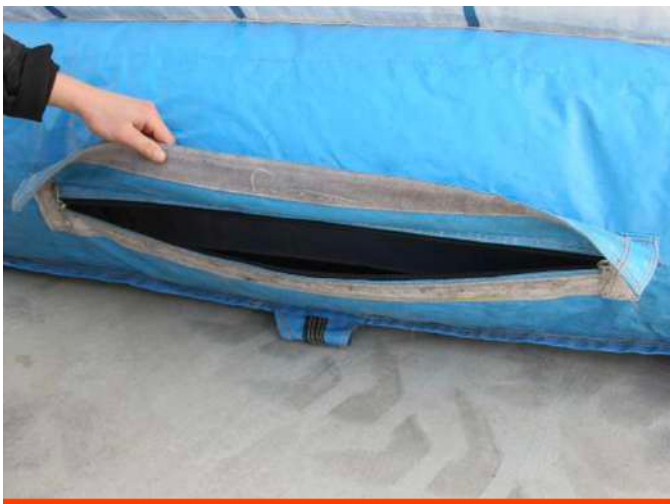
7. Sluit alle luchtuitlaten volledig (deze vindt u vaak aan de zij- of achterzijde van het kussen);